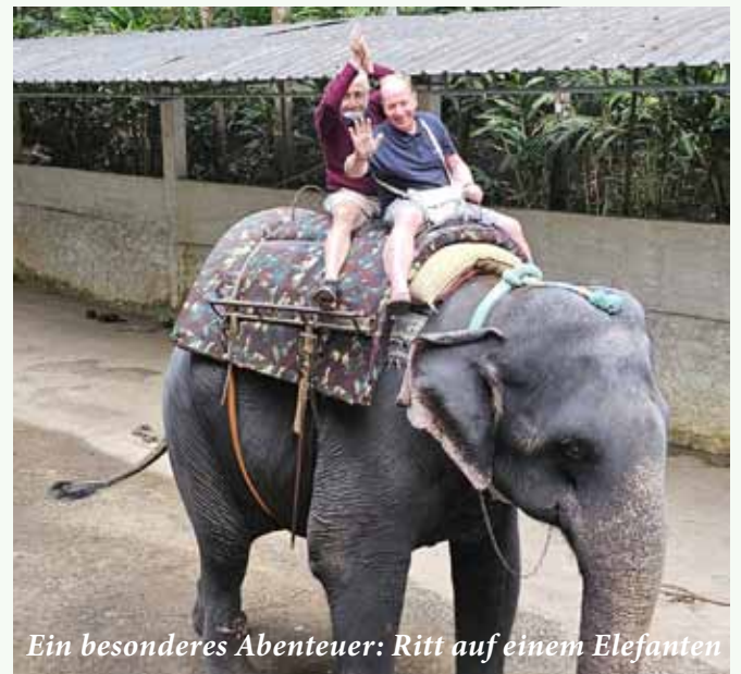
Ein besonderes Abenteuer: Ritt auf einem Elefanten