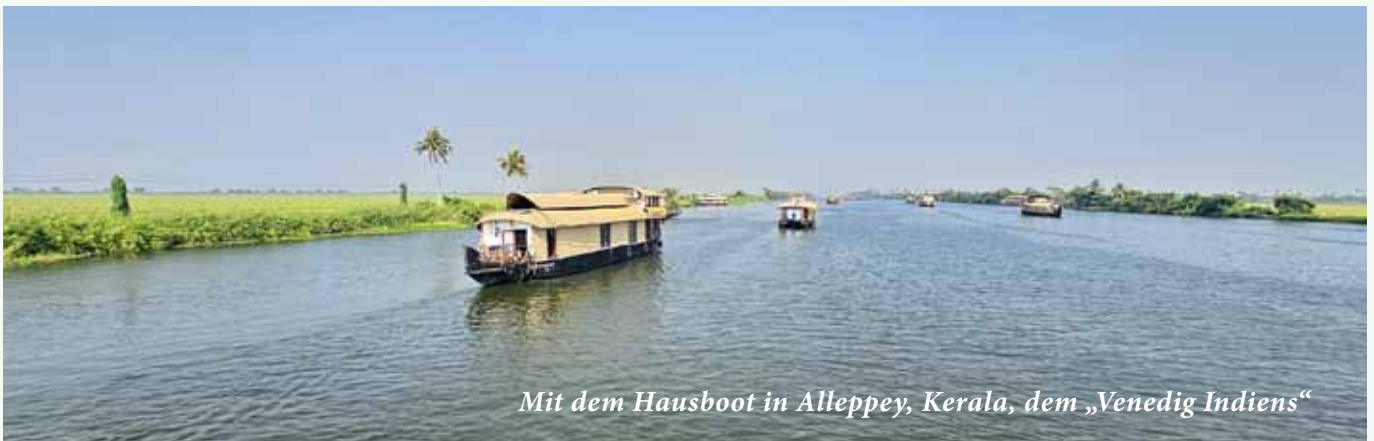
Mit dem Hausboot in Alleppey, Kerala, dem „Venedig Indiens“