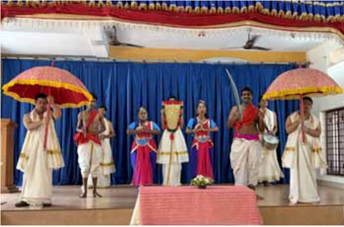
Folklore im Angel's Village