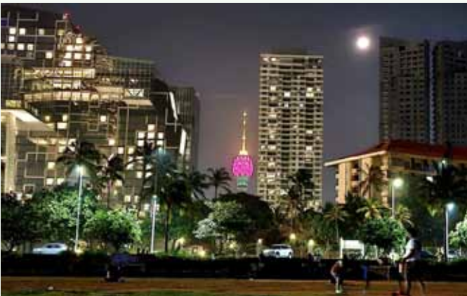
Colombo bei Nacht