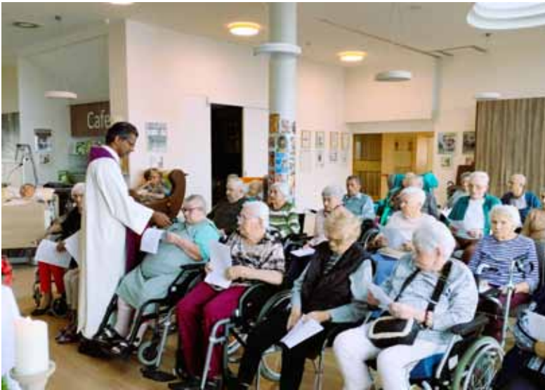
Die regelmäßigen Gottesdienste werden von den Bewohner*innen aktiv mitgestaltet.