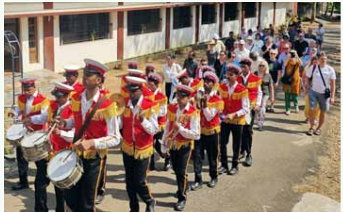
Herzliche Begrüßung in Angel's Village mit Orchestermusik