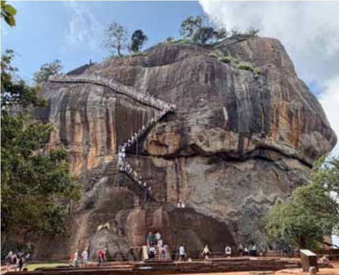
Der Löwenfelsen in Sigiriya, Sri Lanka