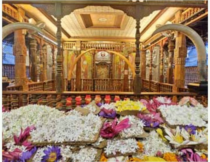
Sri Lanka: Zahntempel von Kandy