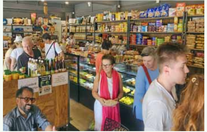
Einer von bereits 5 Angels' Shops in Kanjirappally, Kerala