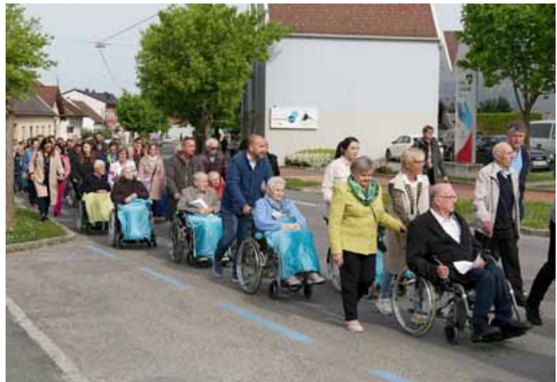
Die Pfarrfamilie macht jährlich eine Fußwallfahrt mit den Bewohner*innen und ihren Angehörigen in die Pfarrkirche.