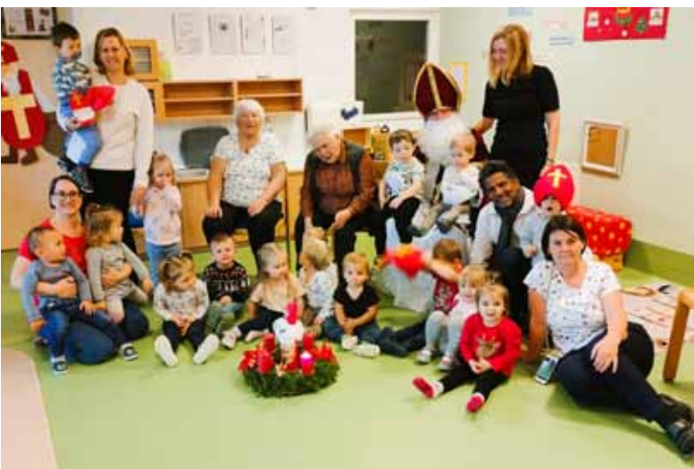
Gegenseitige Besuche bereiten viel Freude.