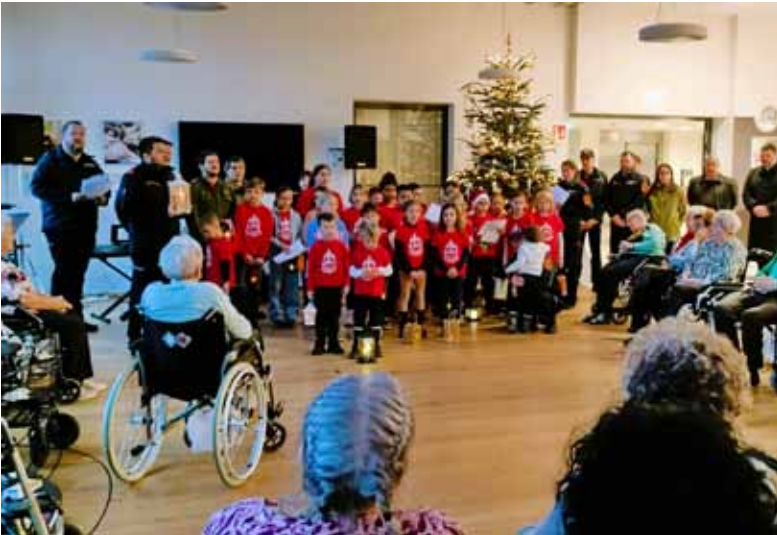
Die Feuerwehr-Kids bringen zu Weihnachten das Friedenslicht ins Haus.